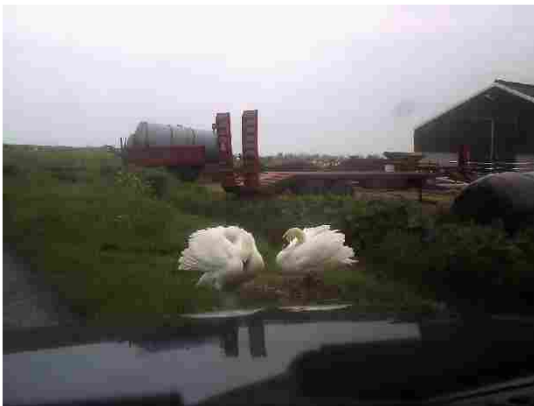
Afbeelding 13: Overal in het groene hart nestelen zwanen van de drifter.

Bovendien is er absoluut niets aan het levensgedrag van Oostveen veranderd en blijft hij linksom of rechtsom het gezagsondermijnende drifterspad bewandelen en zich daarbij ver buiten de grenzen van het fatsoen en oorbare begeven!