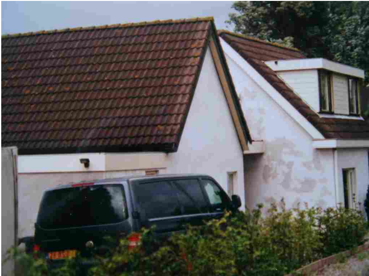
Afbeelding 12: De zwanenslachterij bevindt zich rechts naast de vroegere woning van Oostveen.

Met het oog op de in 2008 begonnen grootscheepse ruiming van inheemse wilde ganzen kan dit een nieuw licht werpen op de toenmalige verlenging van Oostveen's driftvergunning door de minister van LNV. Zonder driftvergunning immers ook geen schimmige pluimveeslachterij. De rol hierin van minister Verburg lijkt ons nopen tot nader justitieel -parlementair onderzoek.