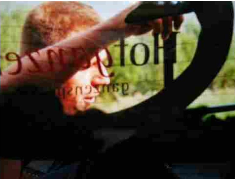
Afbeelding 7: Locatieonderzoek in het Groene Hart, juli 2009.