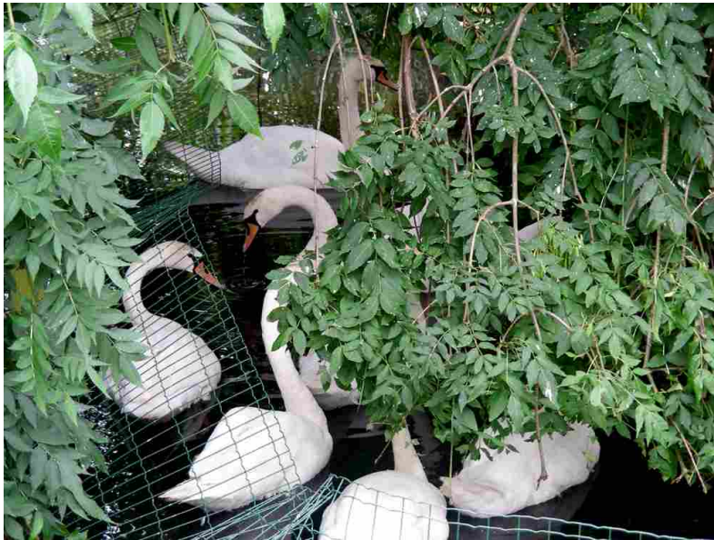
Afbeelding 5: Afgegaasde vijver met slachtzwanen in Weijpoort.

Maar dat zou gans anders gaan lopen dan de wetgever destijds voor ogen stond! Recentelijk bleek er zelfs een nieuwe drifter bij gekomen te zijn. Feitelijk dus een wetmatige onmogelijkheid! In dit door confessionele machtsmachinaties en parlementaire labelkakerijen vergiftigde dossier blijkt echter letterlijk alles mogelijk te zijn!