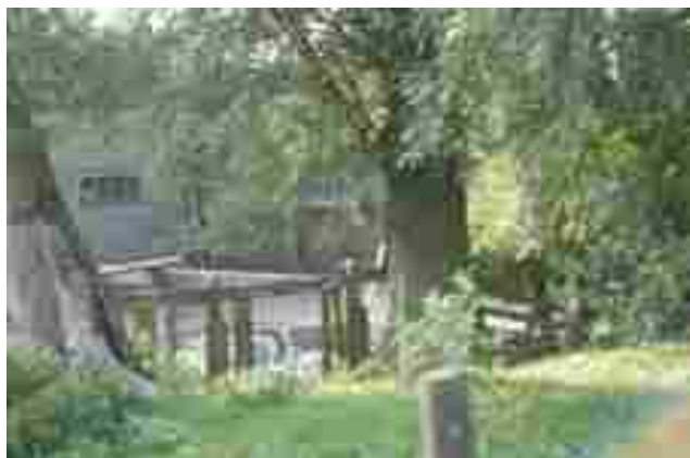
Afbeelding 10/11: Er is naast de slachterij nog altijd de oude ren waarin ter dood gedoemde zwanen vers worden gehouden. Het geheel wordt zowel met camera's als met stil alarm bewaakt.

De zwanenslachterij van Oostveen bevindt zich aan de Weijpoort ten westen van Nieuwerbrug. De geslachte dieren zouden volgens zegslieden overwegend tot blikvoer voor honden en katten worden verwerkt. Oostveen baat zelf een handel in dierbenodigdheden uit waarin dat zwanenvlees zou worden vermarkt.