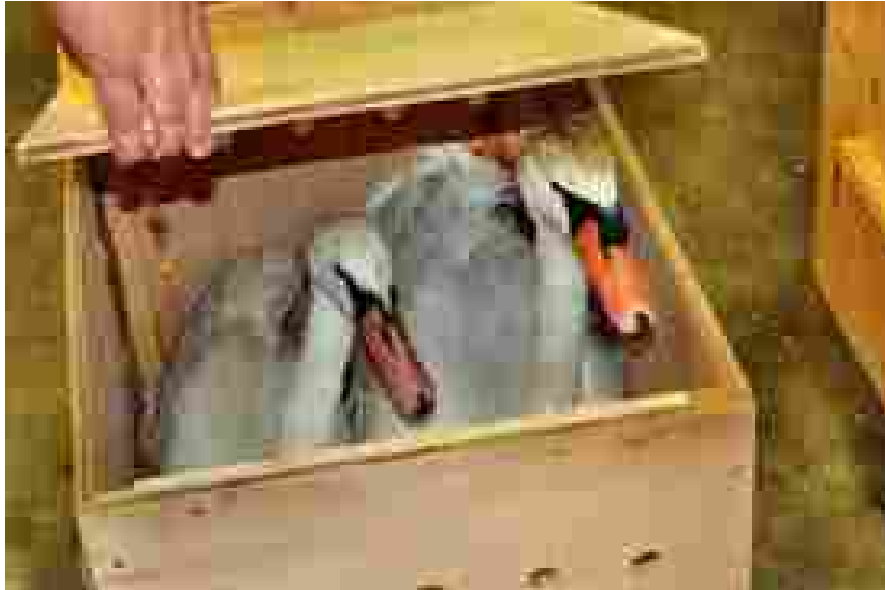
Afbeelding 2: Hoewel er nog steeds zwanenparen levend worden verkocht als parkvogels voor grote tuinen en waterpartijen stelt die handel al jarenlang weinig meer voor. Eenmaal als jonge vogels aangeschaft bereiken zwanen immers leeftijden van meer dan vijftig jaar!

Na de Tweede Wereldoorlog was de handel in zwanenvlees nagenoeg stilgevallen en ook was er weinig vraag meer naar siervogels voor waterpartijen. Zwanen komen namelijk gemakkelijk tot broeden en planten zich royaal voort, waardoor die markt snel verzadigd was. Daarom stopte het gros van de nog resterende drifters met hun bedrijf en liet de uitgezette broedparen aan hun lot over.