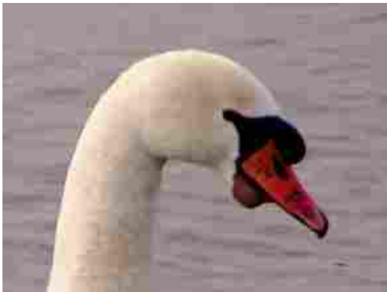
Afbeelding 1: Alle zwanen worden in de snavel gebrandmerkt.

De geleewiekte en van een brandmerk in snavel of zwemvlies voorziene zwanen werden paarsgewijze in het voorjaar in de polders uitgezet waar zij zich vermenigvuldigen. Tijdens de slagpenrui van de oudervogels werden de kuikens door de drifter gevangen, op een hakblok geleewiekt en tevens gebrandmerkt.