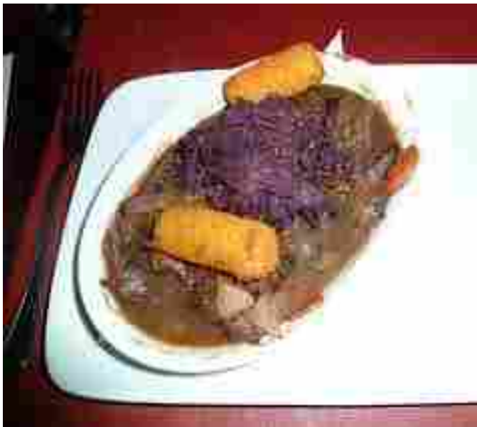
Afbeelding 22: De zwanendrifter maakt er “gehakt” van!

Dat moet dus maar per 1 april 2015 gaan gebeuren!