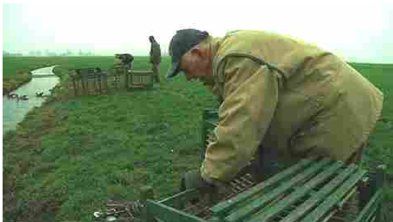
Afbeelding 21 a-c: Eendenkooikers en ganzenvangers doen geen vlieg kwaad sinds er niet meer “voor de dood” wordt gevangen. Alle gevangen dieren worden geringd en weer in vrijheid gesteld. Alleen de zwanendrifter maakt er gehakt van!