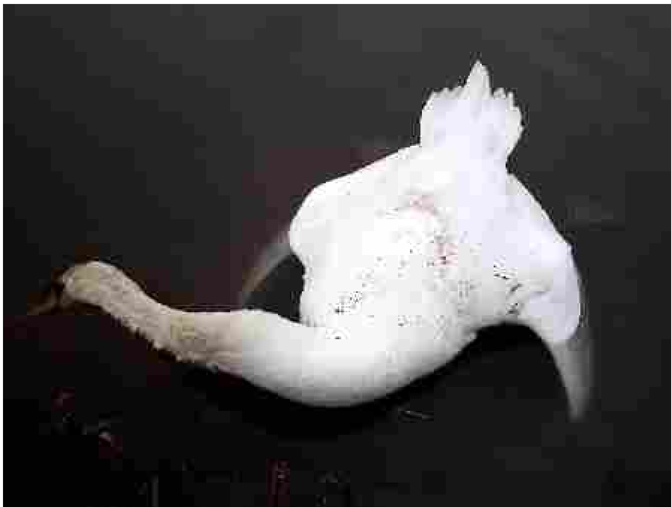
Afbeelding 17: Talloze ooggetuigen maken al jarenlang tevergeefs melding van schandelijke misdragingen door deze zwanendrifter. Maar in het CDA vindt hij nog altijd een onvoorwaardelijke beschermengel.