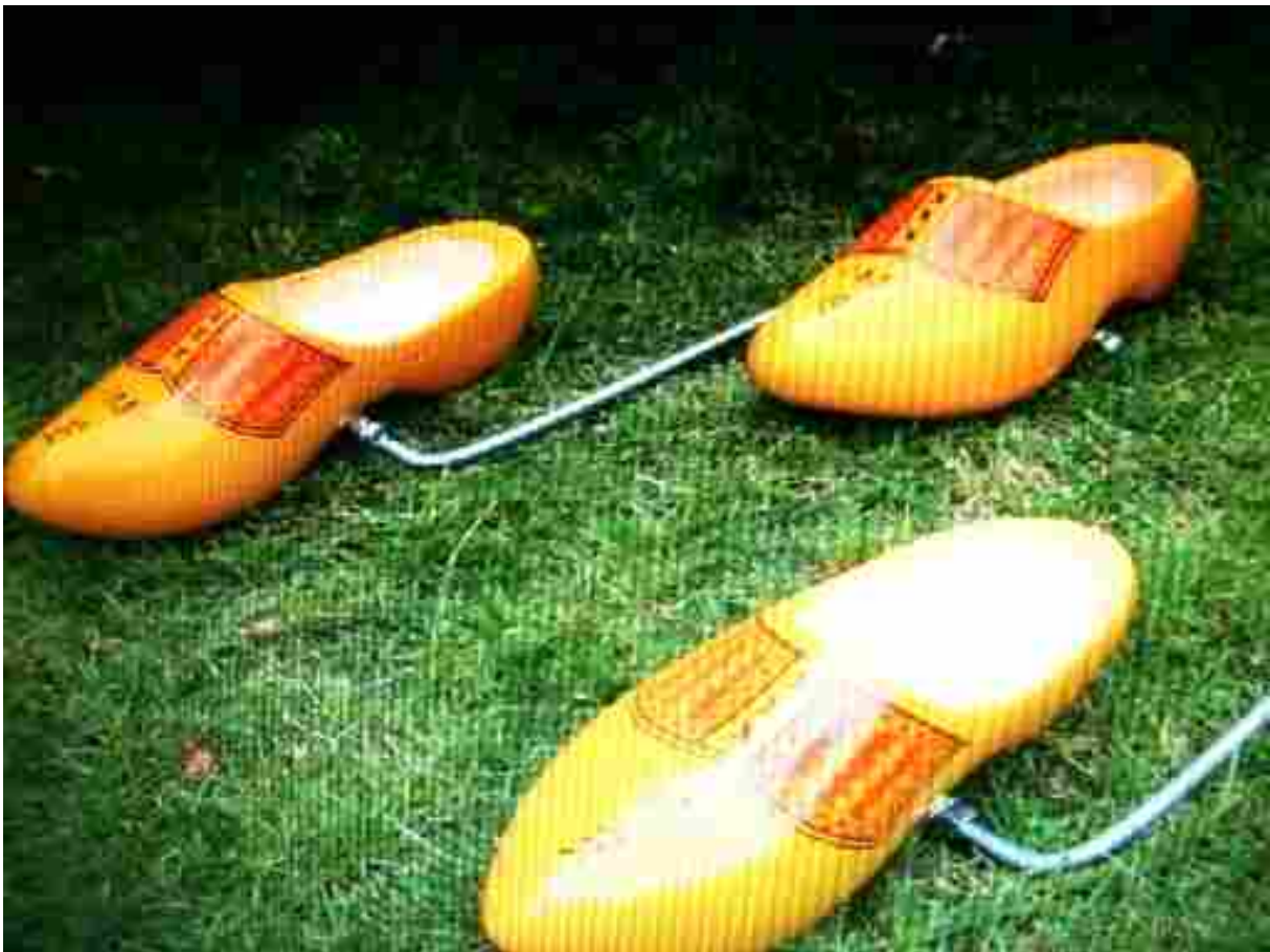
Afbeelding 9: Afgezien van de kleuren geel en groen was er niets folkloristisch aan het optreden van Oostveens zoon op de openbare weg N 458 in boerenbuurtschap De Bree.

Omdat wij niet gecharmeerd waren van een fysiek onderhoud op en langs de openbare weg, zagen wij beleefd af van nadere confrontatie. Maar wij begrepen uit dit voorval, dat streekbewoners ons terecht hadden gewaarschuwd voor het opvliegende karakter van Oostveen en zijn nageslacht.