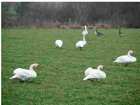
Afbeelding 3/4: Overall ontstonden grotere of kleinere concentraties van knobbelzwanen die feitelijk allemaal nazaten zijn van het verwaarloosde vliegende vermogen van de vroegere zwanendrifters. Want de échte wilde knobbelzwaan is destijds door hun toedoen uitgestorven.

Dit leidde vanaf de jaren '60 tot het ontstaan van een snel in omvang toenemende broedpopulatie: in eerste instantie in de laagveenpolders van Zuid – en Noord- Holland en Utrecht, maar van daaruit al snel ook elders in ons land.