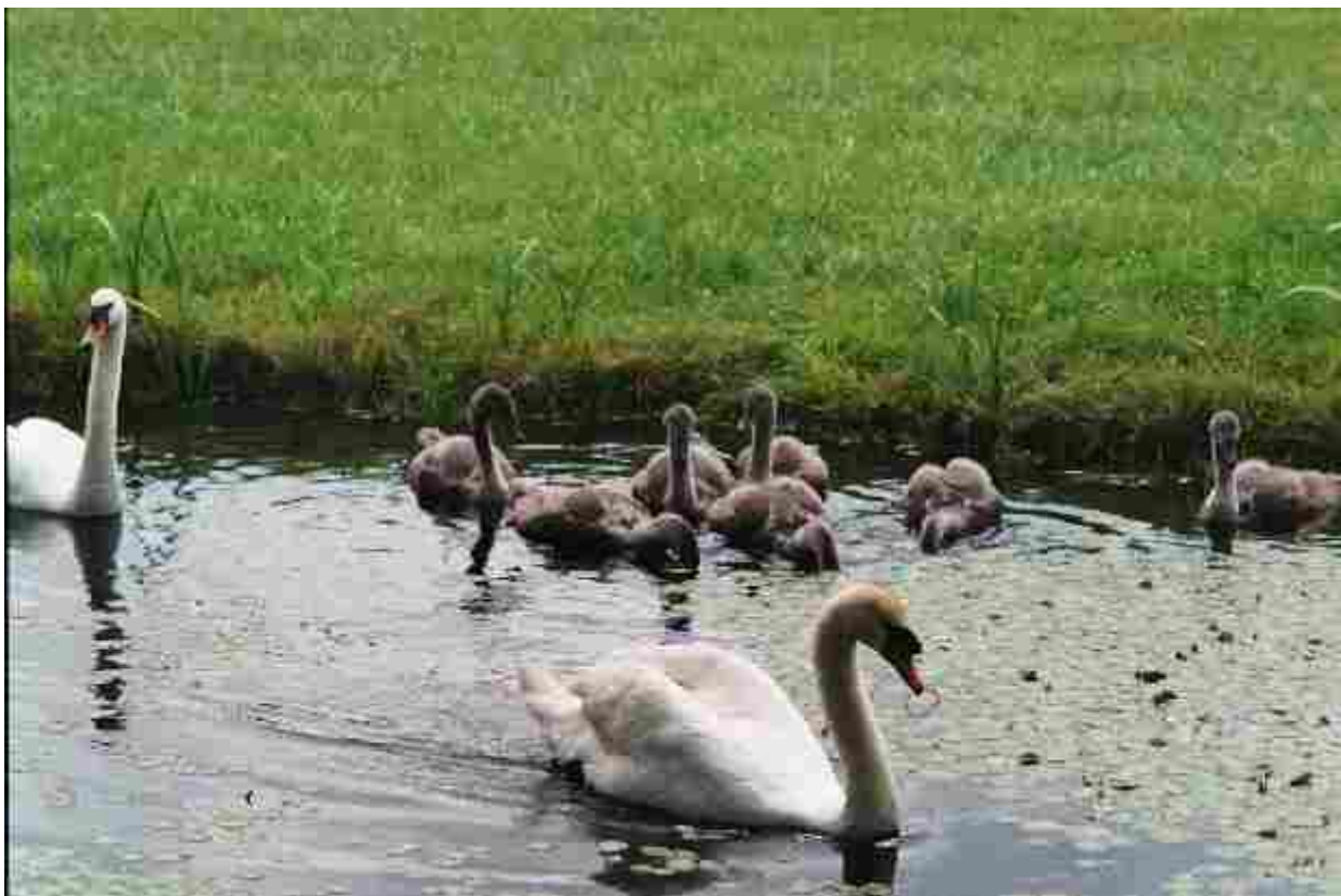
Afbeelding 14: Dit is volgens talloze meldingen de leeftijd waarop de jonge zwanen worden gevangen, gebrandmerkt en geleewiekt. Daar komt geen nagelschaartje aan te pas!

Feitelijk had hij dus wegens stroperij aangehouden, opgebracht en in verzekerde bewaring moeten worden gesteld. Maar na het opmaken van PV werd hij heengezonden. Wat gebeurde er op 26 februari werkelijk?