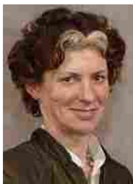
Afbeelding 6: Als persoonlijke kennis van Oostveen misbruikte Gerda Verburg haar positie als minister van LNV: een bestuurlijk hals misdrijf!

Ook tijdens ons onderzoek zou op onthutsende wijze blijken, dat primitief- middeleeuwse misdragingen door het CDA te vuur en te zwaard worden beschermd, ten koste van de veiligheid van boer en burger in onze publieke ruimte. Maar vooral ten koste van de beschaafde en respectvolle omgang met dieren!